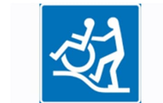
Vaativa esteetön reitti